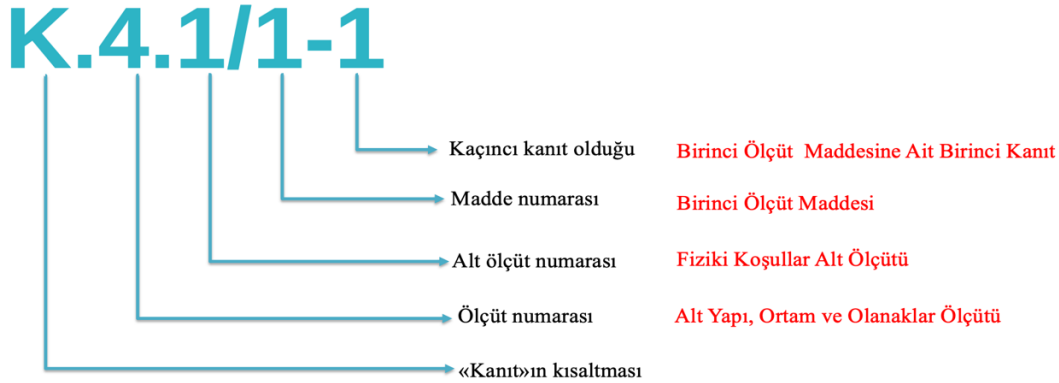
Şekil 2. Kanıt ve Göstergelerin Kodlanması